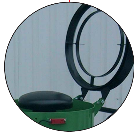
SM 100 top