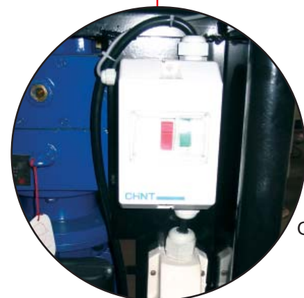
Gear og motor